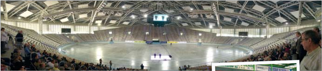
HALA ARENA ŁÓDŹ